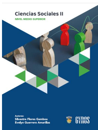
Ilustración 3. Portada del libro Ciencias Sociales II

Se recomienda el uso del libro de texto Ciencias Sociales II de los autores Flores y Guerrero (2026), así como de la Plataforma Educativa Moodle: https://nms.uas.edu.mx/ , ya que su diseño se ajusta al programa de bachillerato escolarizado en la UAS. No obstante, también es sugerible consultar otros recursos y fuentes originales, con diferentes puntos de vista, enfoques y matices, lo que enriquece el conocimiento y fomenta una formación más sólida. Además, el uso de fuentes primarias ayuda a desarrollar habilidades de investigación y análisis crítico, fundamentales para un pensamiento autónomo y una comprensión más profunda de los temas estudiados.